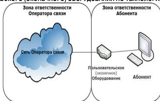
СХЕМА ВКЛЮЧЕНИЯ ПОЛЬЗОВАТЕЛЬСКОГО (ОКОНЕЧНОГО) ОБОРУДОВАНИЯ ПО ТЕХНОЛОГИИ FAST ETHERNET/ GIGABIT ETHERNET