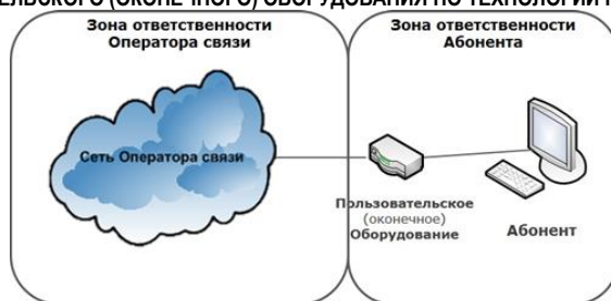
СХЕМА ВКЛЮЧЕНИЯ ПОЛЬЗОВАТЕЛЬСКОГО (ОКОНЕЧНОГО) ОБОРУДОВАНИЯ ПО ТЕХНОЛОГИИ WNGN