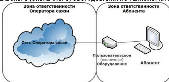
СХЕМА ВКЛЮЧЕНИЯ ПОЛЬЗОВАТЕЛЬСКОГО (ОКОНЕЧНОГО) ОБОРУДОВАНИЯ ПО ТЕХНОЛОГИИ WNGN