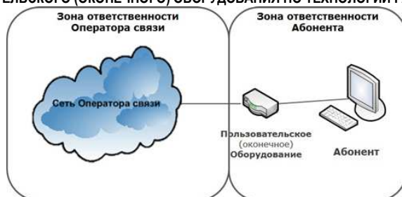
СХЕМА ВКЛЮЧЕНИЯ ПОЛЬЗОВАТЕЛЬСКОГО (ОКОНЕЧНОГО) ОБОРУДОВАНИЯ ПО ТЕХНОЛОГИИ WNGN